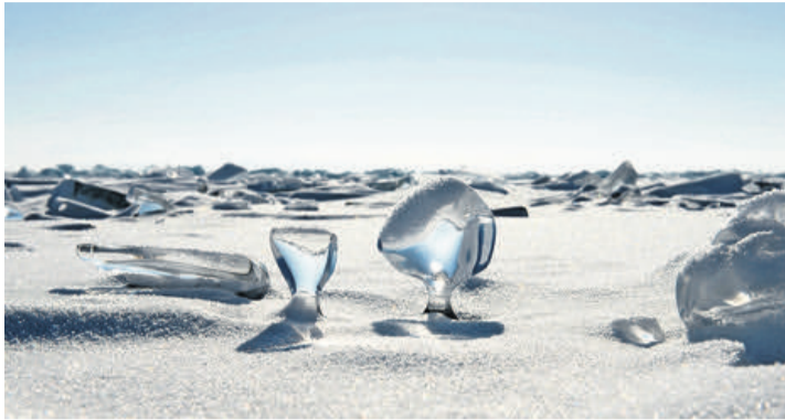
Ici, le froid, le vent et le soleil jouent ensemble pour créer des sculptures de glace. NICOLAS PERNOT

Parfois presque surréalistes, les scènes photographiques prises au lac Baïkal nous invitent à la découverte d'un monde extraordinaire