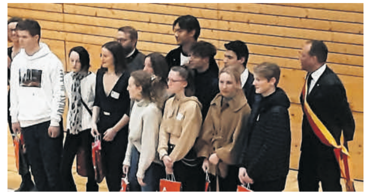
Nos jeunes citoyens entourés du maire et de ses adjoints.