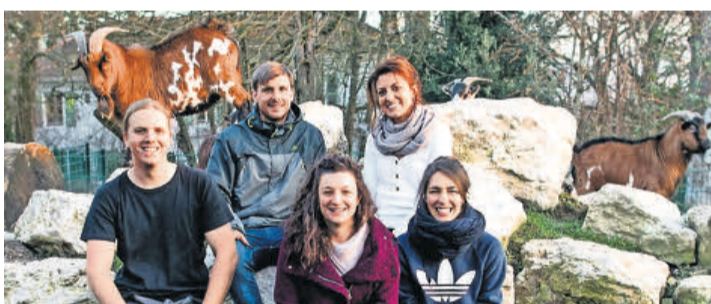
L'équipe du Bioparc Genève. BIOPARC GENEVE

L'institution a été créée en 1991 pour la conservation de la biodiversité