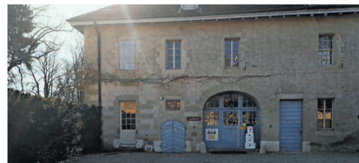
Le cadre historique du jardin d'enfants Les petits Loups.

Le jardin d'enfants est ouvert tous les matins de 7 h 45 à 12 h, et les après-midi du lundi, mardi et jeudi de 13 h 15 à 17 h 30. Les enfants se retrouvent en petit groupe - 18 maximum par demi-journée - et suivent des journées structurées avec jeux libres, moments de partage, collation, activités spécifiques comme le langage, la musique ou la cuisine et des sorties en plein air.