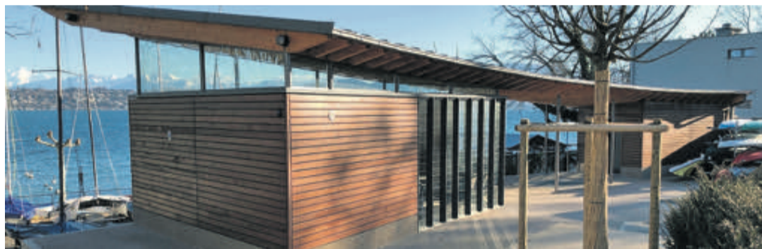
Port Saladin. MAIRIE DE BELLEVUE

Deux éléments ont été construits en surface, la buvette du club nautique ainsi que le secré-