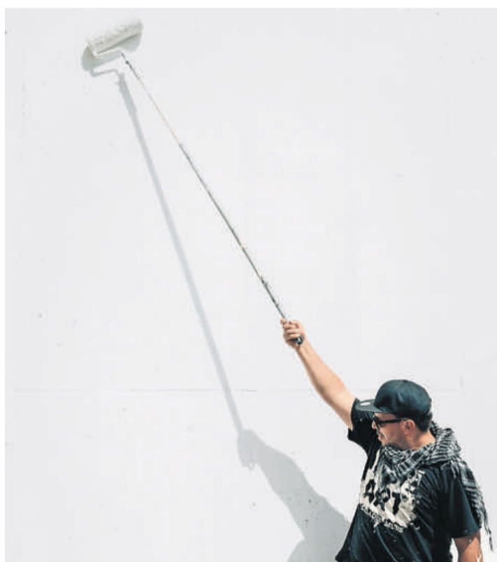
Détail d'une œuvre de Nils Thibaut. NILS THIBAUT

En parallèle de cette exposition se tiendront de nombreuses médiations en lien avec le Street