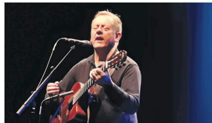
Luka Bloom, les yeux fermés sur scène. TARA KERPELMAU PUIG

Son dernier album, «Sometimes I Fly» («Parfois je vole»), vient de sortir.