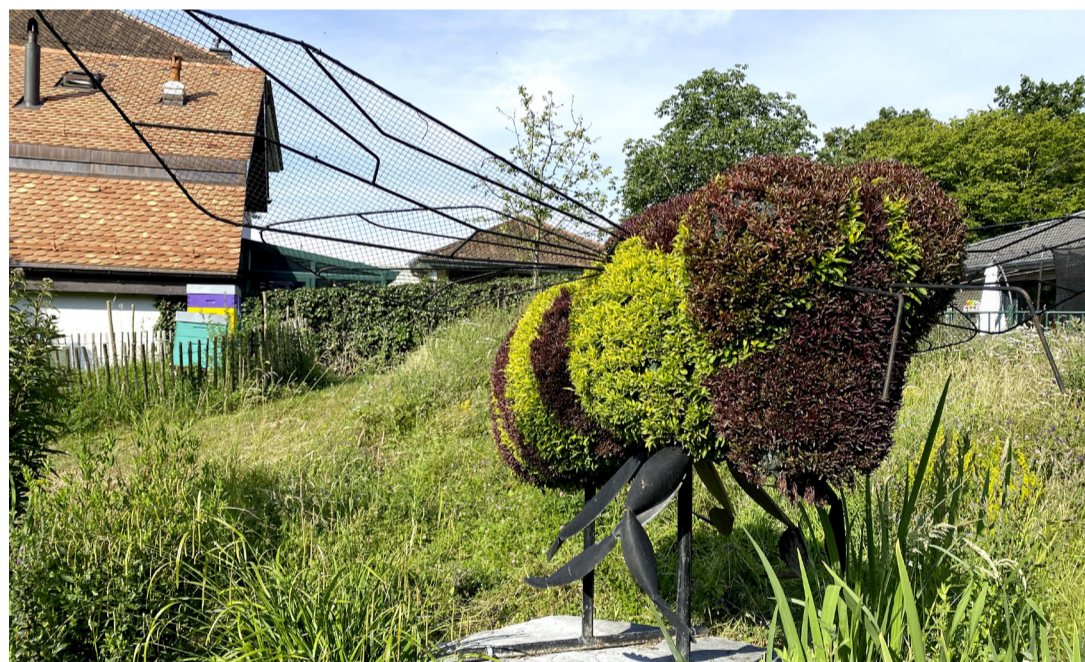
Cette sculpture végétale a été installée au parc Simon-Eggly. CAROLINE DELALOYE

Grâce au travail du Service des espaces extérieurs, qui entretient les parcs et bandes fleuries, les abeilles citadines peuvent butiner pendant toute la saison une grande variété de fleurs.