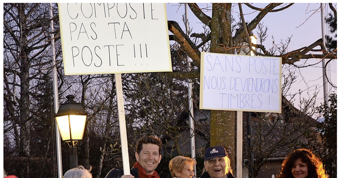
Les Meynites s'étaient déjà mobilisés en mars 2019.

À l'aune de sa stratégie 2021-2024, qui laissait espérer une forme de retour en arrière, les autorités ont à nouveau accueilli une délégation de La Poste lors d'une nouvelle séance de négociations, le 23 juin dernier. Cette fois-ci, les magistrats meynites ont pu compter sur le soutien de leurs collègues des communes de Cologny, Gy, Jussy, Presinge, Puplinge, Vandœuvres et Collonge-Bellerive, ainsi que des représentants de la Fondation immobilière de Meinier, de la Fondation de la Palanterie et même de la banque Raiffeisen. Toutes et tous ont apporté des arguments de diverses natures soulignant la pertinence et la nécessité du maintien de l'office de Meinier, ont proposé des compromis et des partenariats allant dans ce sens, et ont exprimé