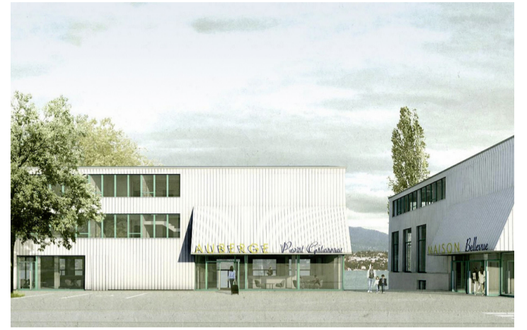
Illustration du projet gagnant qui verra le jour sur le site de Port Gitana. ROBIN-BADER

Gageons que les habitants de la commune seront doublement comblés; par l'attractivité liée à la culture et aux loisirs et par le panorama exceptionnel remis en valeur par le nouveau site. Caroline Delaloye