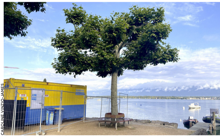
Les travaux ont débuté sur les quais de Corsier.

La date d'ouverture du chantier ayant été décalée en raison de la crise sanitaire, l'ordre de la réalisation des travaux a été inversé. Ainsi, la rampe qui devait être achevée pour la saison estivale sera gardée en l'état afin que les bateaux puissent être mis à l'eau cet été et le chantier débutera avec le réamé-