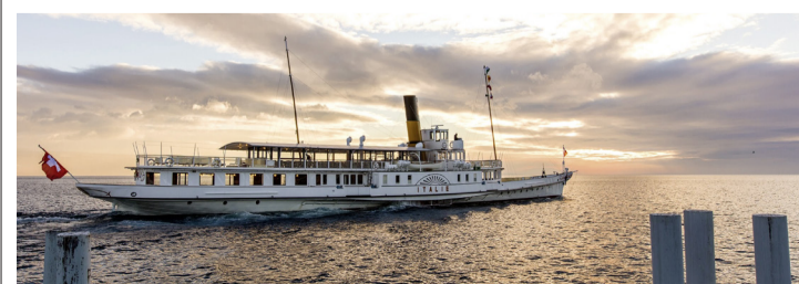
L'Italie vogue sur nos eaux douces. CGN

Les cartes sont disponibles seulement pour les habitants de la commune. Une pièce d'identité sera demandée au guichet de la mairie, là où leur vente s'effectue. Elles sont disponibles un mois à l'avance et il n'y a ni remplacement ni remboursement. Bonne balade! Feli Andolfatto