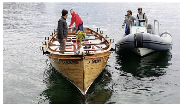
«La Romande» arrive au port d'Hermance. STÉPHANIE VAGNETTI

Si plusieurs réparations ont été effectuées au cours des ans, cette