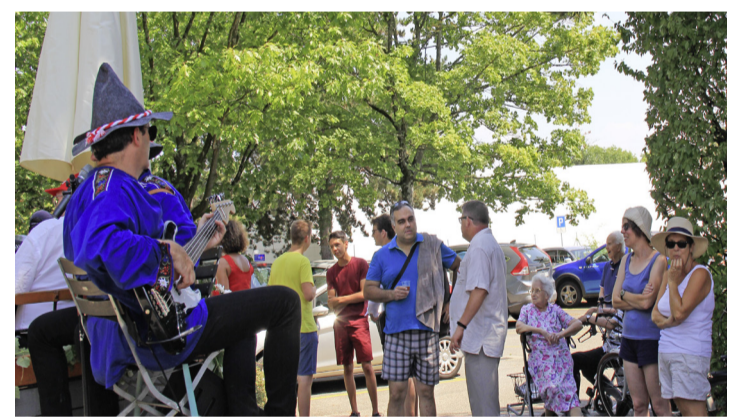
Un des rendez-vous de la fête nationale. MAIRIE DE PREGNY-CHAMBÉSY