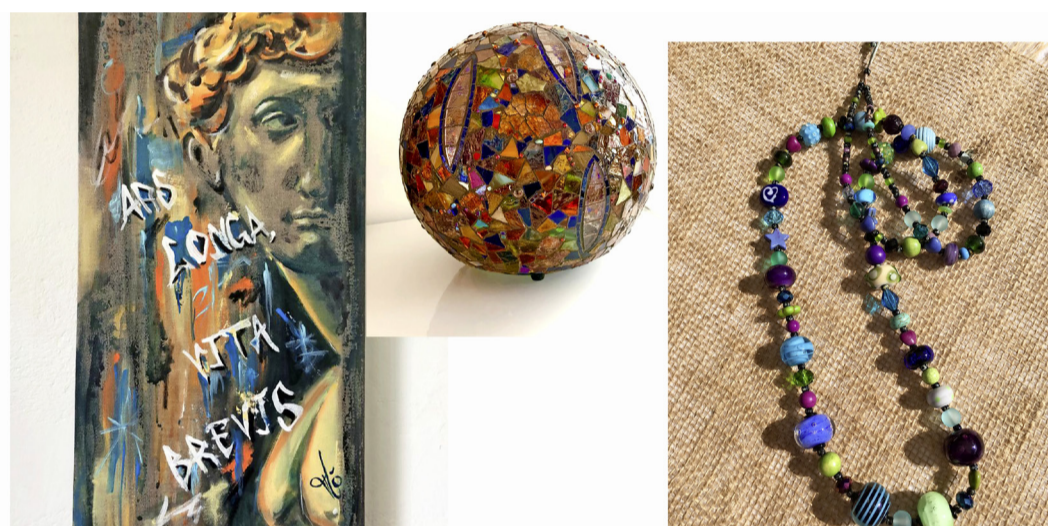
Diverses œuvres que vous pourrez admirer. MARC GUILLEMIN

Libre à vous de leur passer commande pendant la journée si vous craquez pour l'une ou l'autre de leurs œuvres!