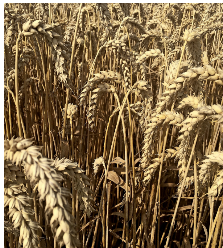
Les épis de blé chantent sous le soleil. STÉPHANIE JOUSSON