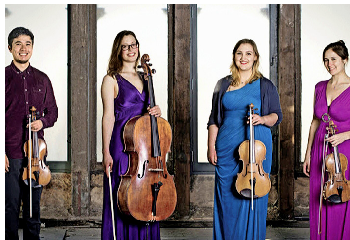
L'ensemble Aurea Quartet. AUREA QUARTET