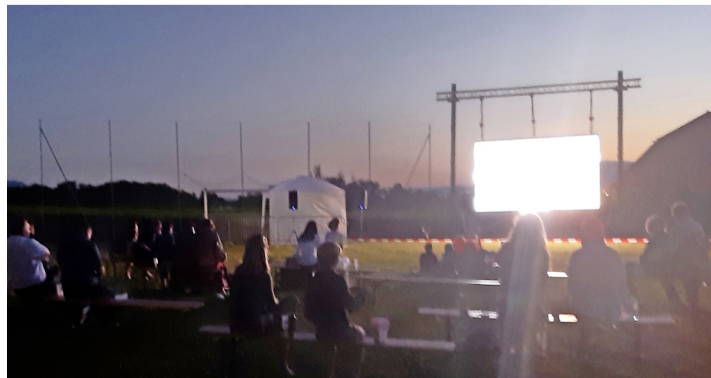
Le cinéma en plein air à Anières. ANTOINE ZWYGART

Une manifestation à reprogrammer l'été prochain avec plaisir, pour le bonheur de tous les Aniérais. Antoine Zwygart