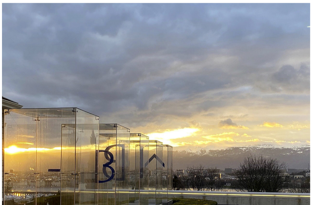
Un lieu d'une richesse incroyable ouvert au public. CATHERINE GAUTIER LE BERRE

Dimanche 27 septembre , de 10 h à 19 h, inauguration des nouveaux bâtiments de la Fondation Martin Bodmer. Plus d'infos sur fondationbodmer.ch