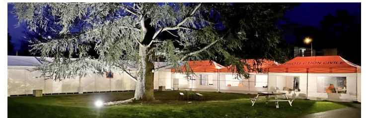
L'installation à la Clinique des Grangettes.