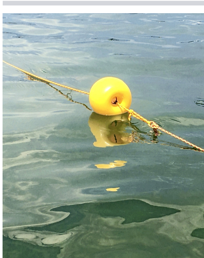
Faute de pouvoir parcourir le monde cet été, nombreux sont ceux à avoir profité des eaux du lac. STÉPHANIE JOUSSON