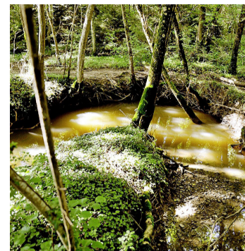
Les bois d'Hermance.