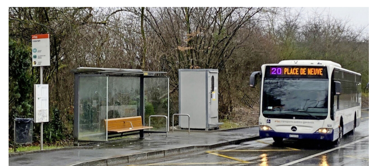
Le nouveau terminus TPG de Valavran. CAROLINE DELALOYE

Voilà qu'aujourd'hui, les connexions ville-campagne re-