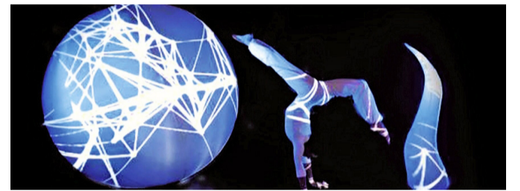
Synthesis. COMPAGNIE LUMEN CRÉATIONS