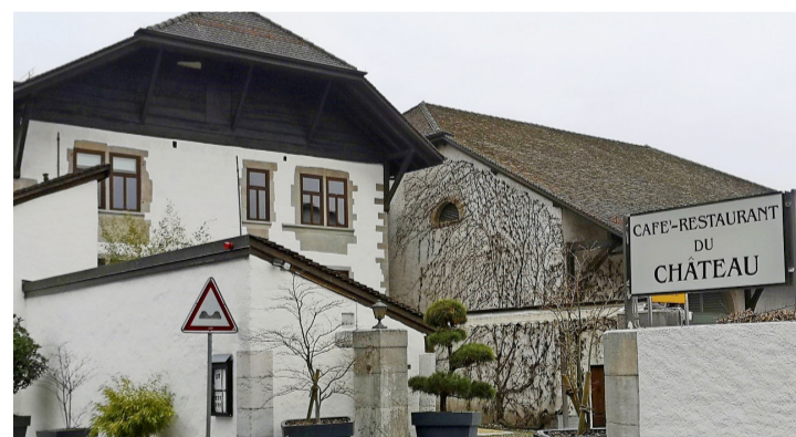
Le restaurant du Château à Genthod. TARA KERPELMAN PUIG

La Mairie - www.genthod.ch - recherche des jeunes domiciliés dans la commune et âgés de 16 ans révolus au 1 er juin 2021 pour ses services Voirie, Parcs et promenades, et Conciergerie. Les dossiers de candidature doivent être envoyés d'ici au 30 avril.