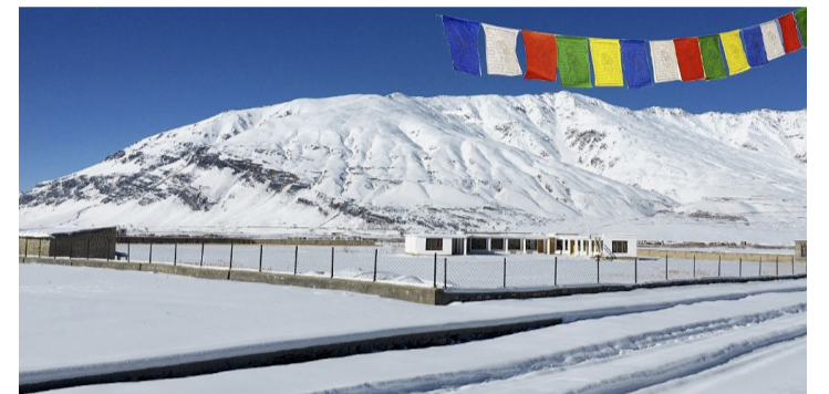
Vue de l'école et ses abords. TANTAR LUNDUP