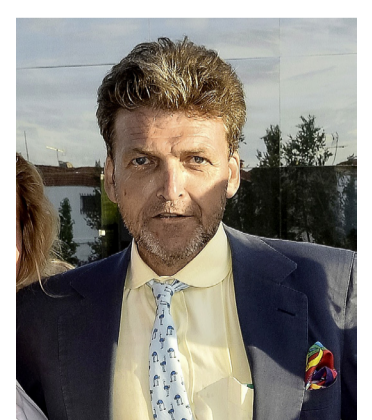
Benjamin de Rothschild.

Descendant de la dynastie Rothschild, le baron était connu pour son franc-parler mais aussi pour sa générosité, notamment à travers ses fondations pour l'en-