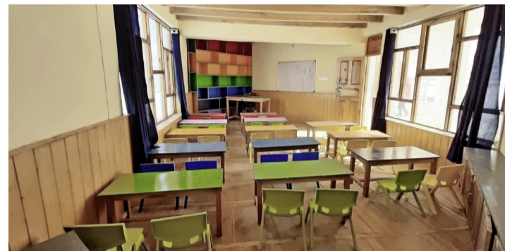
L'intérieur coloré d'une des nouvelles classes. APECH