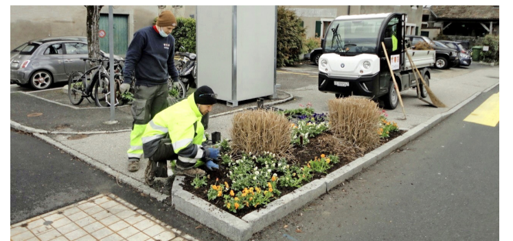
Les jardiniers en pleine plantation. DENISE BERNASCONI

Eh bien, avec l'arrivée du printemps et son lot d'incertitudes, c'est ce que nous avons décidé de faire. C'est ainsi qu'en arpentant les rues du village, nous avons surpris nos employés communaux en pleine plantation de fleurs d'agrément dans les bordures, bacs et jardinières de la commune, composés principalement de pensées. Des pensées à grosses fleurs et des pensées à pe-