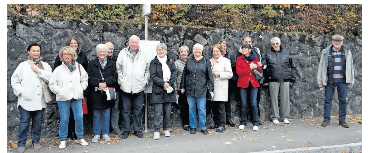
Les aînés d'Hermance sur le départ.