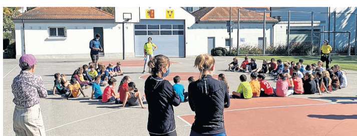
Les enfants en train d'écouter les consignes. CAROLINE DELALOYE

Cette année, ce sont environ 70 enfants qui ont couru chaque vendredi midi pendant huit semaines, entraînés par des membres du co-