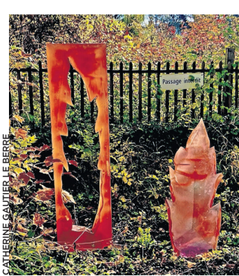
«Caprice d'automne» de Chantal Carrel.