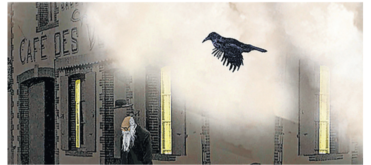
Détail d'une photo de la série «Après la gloire», PASCAL NORDMANN

Fondation Auer Ory , rue du Couchant 10. Sur rendez-vous au 022 751 27 83 ou en écrivant à auer@auerphoto.com.