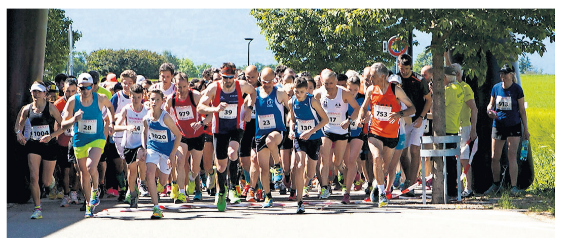
Et c'est parti pour une course folle! COURIR POUR AIDER