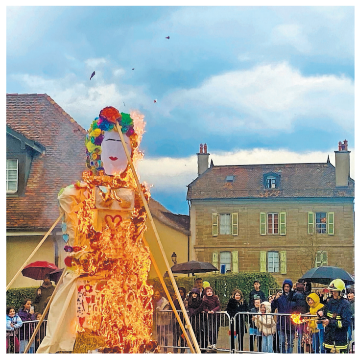
Le Bonhomme Hiver a bien brûlé dans la cour de l'école du Manoir à Cologny pour annoncer l'arrivée du printemps et du beau temps.