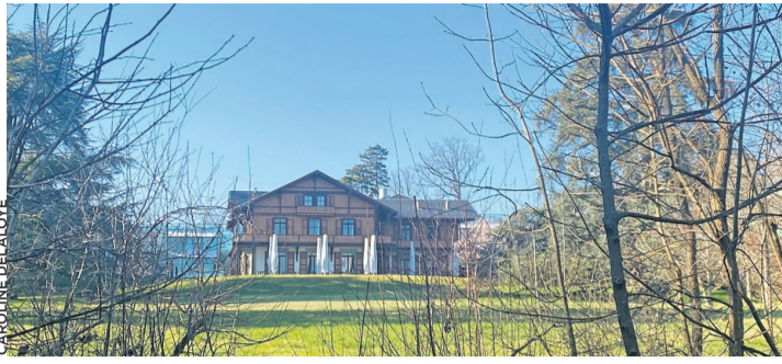
Chalet du domaine Sans Soucis où vécut la comtesse.

Vous l'aurez peut-être remarqué au gré de vos pérégrinations dans le village, un nouveau chemin baptisé Comtesse-de-Pourtalès a fait son apparition dans la commune, il y a quelques mois, à la hauteur du 22, chemin de la Chénaie. Le Conseil administratif en a décidé ainsi à la suite de la construction d'un nouvel immeuble dans le secteur. Mais qui était la comtesse? Née en 1868,