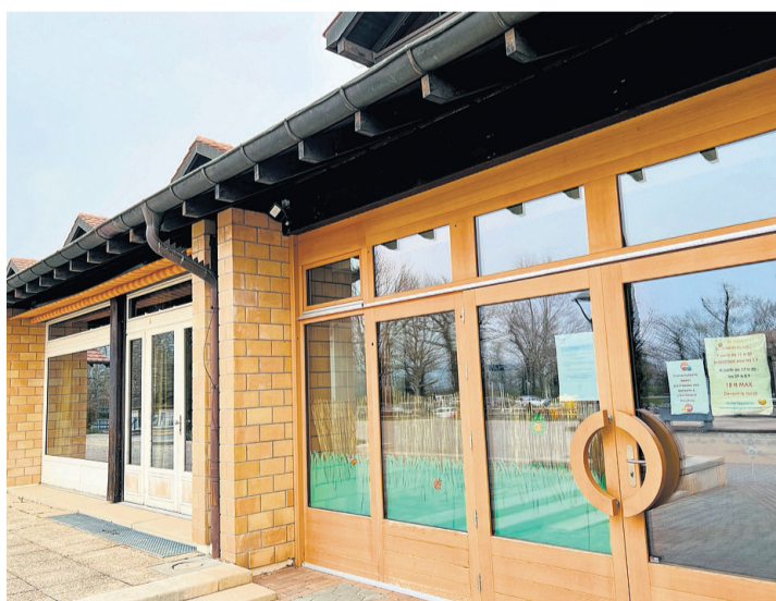
L'entrée du local parascolaire situé au Nouveau groupe scolaire. PATRICK JEAN BAPTISTE

À Corsier, une équipe de huit animatrices fournit la prestation parascolaire, et accueille les enfants des classes IP à 8P de 11h30 à 13h30 dès la sortie des classes jusqu'à la reprise des cours, et de 16h à 18h jusqu'à leur départ avec leurs accompagnateurs attirés, selon leur abonnement. L'équipe