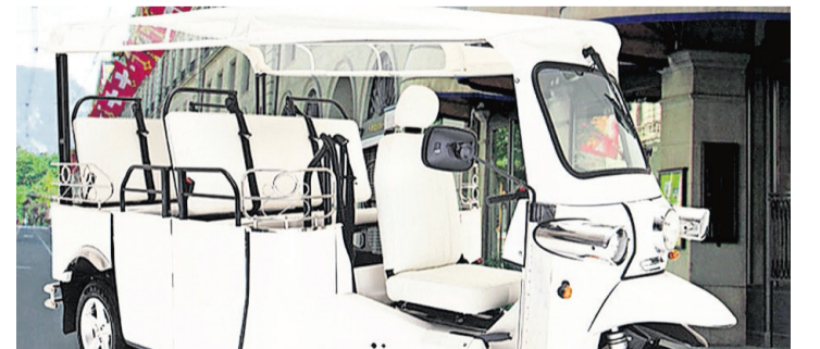
Le fameux tuk-tuk électrique. JEAN-PIERRE PONT