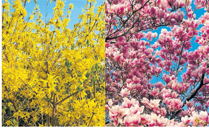
Forsythias et magnolias sont à la fête. CORINNE SUDAN

Le retable de l'église Saints-Pierre-et-Paul à Meinier se voit offrir une nouvelle vie, grâce aux mains habiles de deux restauratrices, Guillemette de Rougemont et Marie-