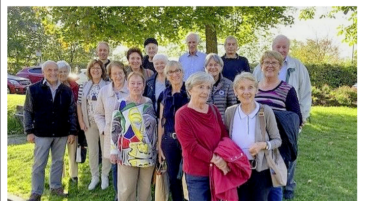
Les aînés posent pour leur chauffeur. LE CHAUFFEUR DU CAR