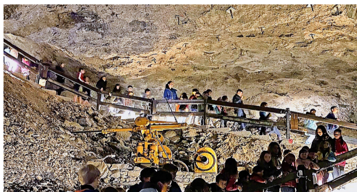
Les enfants et accompagnants dans la mine. ÉCOLE DE CHOLEX

le Train des Mineurs pour pénétrer dans la montagne. Et comme chaque wagon dispose de plateformes ouvertes à ses extrémités, nombreux sont les intéressés à vouloir s'y asseoir.