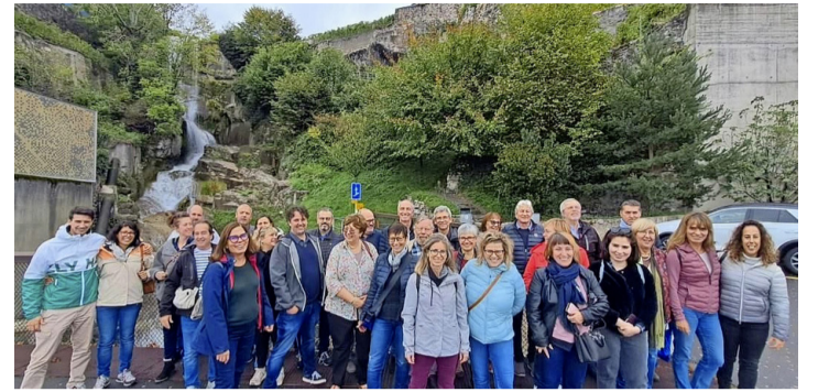
Les participants devant le Vinorama de Rivaz.