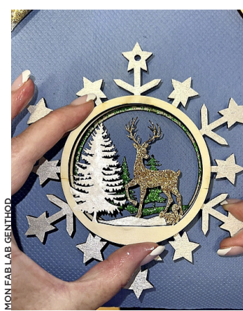
Créez vous-même une suspension de Noël.

Afin de pouvoir prévoir assez de matériel pour tout le monde, l'association demande aux personnes désirant participer de leur envoyer un e-mail indiquant le ou les ateliers qui les intéressent à atelier@monfablab.ch . Tara Kerpelman Puig