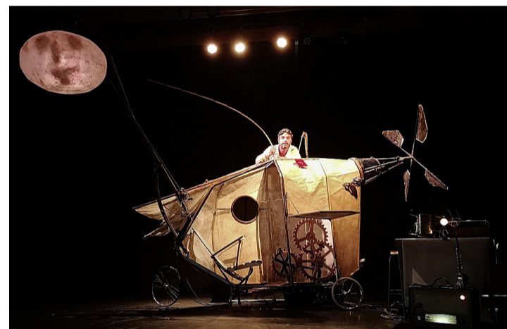
Le savant fou tient l'échelle qui permet à Cheeseboy d'accéder à la lune. TARA KERPELMAN PUIG

Le début est très interactif et l'inventeur pose des questions aux enfants, qui répondent avec enthousiasme. On est transporté à travers ses pensées et cogitations nombreuses et confuses, parmi lesquelles il nous raconte une histoire. L'histoire d'un garçon qui est fait de fromage, qui a une famille faite de fromage, et qui habite dans une maison de fromage sur une planète de fromage. Mais tristement, frappée par un météore, sa planète se transforme en fondue. Lui, échappe à ce terrible sort et passe le reste de son temps à essayer de retrouver sa famille.