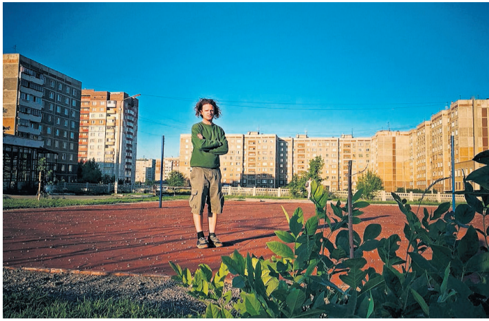
Le réalisateur Gabriel Tejedor.

Ayant dû faire face à une multitude de problèmes divers auxquels sont venus s'ajouter le Covid notamment et l'invasion de l'Ukraine par la Russie en février