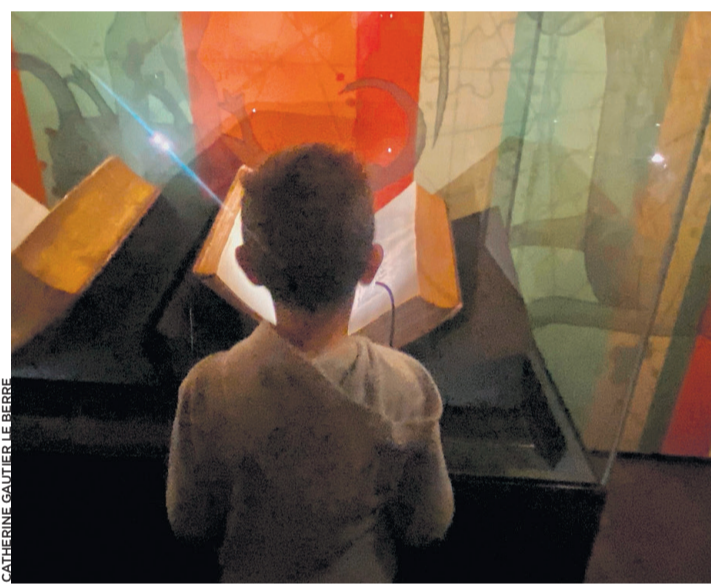
Un enfant contemplatif devant un manuscrit du XIV e siècle.

À la Fondation Bodmer jusqu'au 9 juillet. Réservations à info@fondationbodmer.ch .