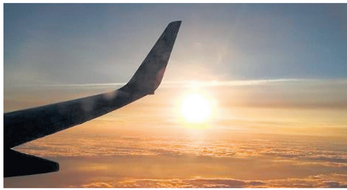
Soleil couchant au-dessus des nuages. TARA KERPELMAN PUIG

Les vols de calibration servent à, vous l'aurez deviné, calibrer les installations d'aide à la navigation aérienne de l'aéroport de Genève qui sont opérées par Skyguide. Tout simplement, cela veut dire qu'ils comparent l'affichage d'un appareil de mesure