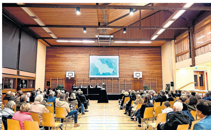
La soirée de présentation du plan directeur communal.

Outre la présentation publique du mardi 14 mars, le plan directeur communal peut être actuellement consulté à la mairie de Corsier. Il est également possible de le visualiser, ainsi que sa vidéo innovante et sa présentation sur le site internet dédié: www.corsier.ch/plan-directeur-communal . Patrick Jean Baptiste