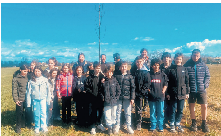
Les 8p devant l'un de leurs arbres.

n'est pas uniquement symbolique car il a une importance favorable sur la biodiversité et l'environnement. Corinne Sudan