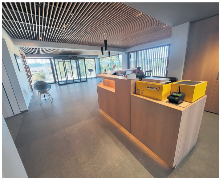
L'entrée de la mairie avec son bureau de poste. ANTOINE ZWYGART

Si vous désirez vous marier en notre commune, une nouvelle salle de mariage vous attend, elle est magnifique. Encore une précision importante, son accès se fait pour l'instant uniquement par l'arrière du bâtiment et non comme à l'habitude par les escaliers de devant. La raison en est que les travaux de rénovation énergétique démarrent dans la