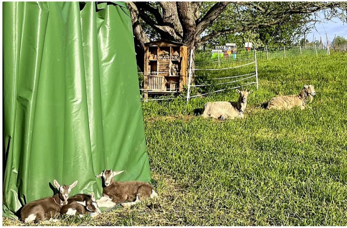
Dans la prairie Bellecombe, bien installées. OLIVIER LOMBARD

La mise en commun de ces deux objectifs s'est concrétisée par la venue récente à Choulex de huit chèvres qui n'ont plus la