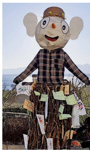
Le bonhomme paré de tous ses petits mots. TINA HÖHN JOLIVET

peut-être mieux ainsi, il était tellement beau ce bonhomme, ça aurait été dommage de le voir partir en fumée. Denise Bernasconi