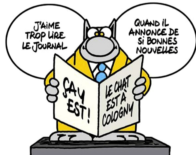
Dessin de Philippe Geluck. MAIRIE DE COLOGNY