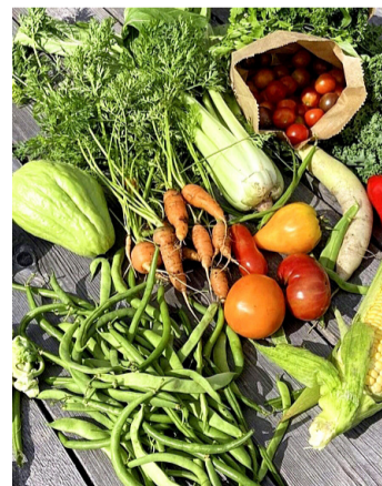
Des légumes vivants. L'ORTIE

sonnes qui souhaitent soutenir un projet s'inscrivant dans un profond changement de paradigme écologique.