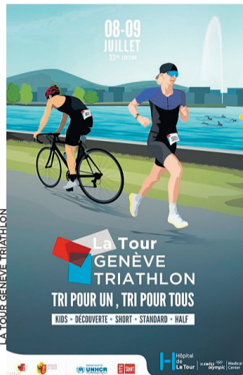
Cologny, Vandœuvres, Meinier, Anières et Collonge-Bellerive.

Le passage de cet événement, qui n'est autre que le plus grand triathlon de Suisse, s'avère une vitrine mettant en valeur notre commune. Cela engendrera nécessairement des perturbations au centre du village lors du passage des participants. La course aura également lieu à Genève,