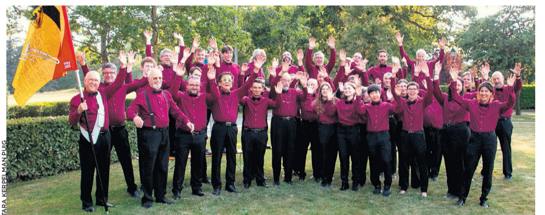
Une harmonie fait partie d'un village qui perpétue la musique populaire en son sein.