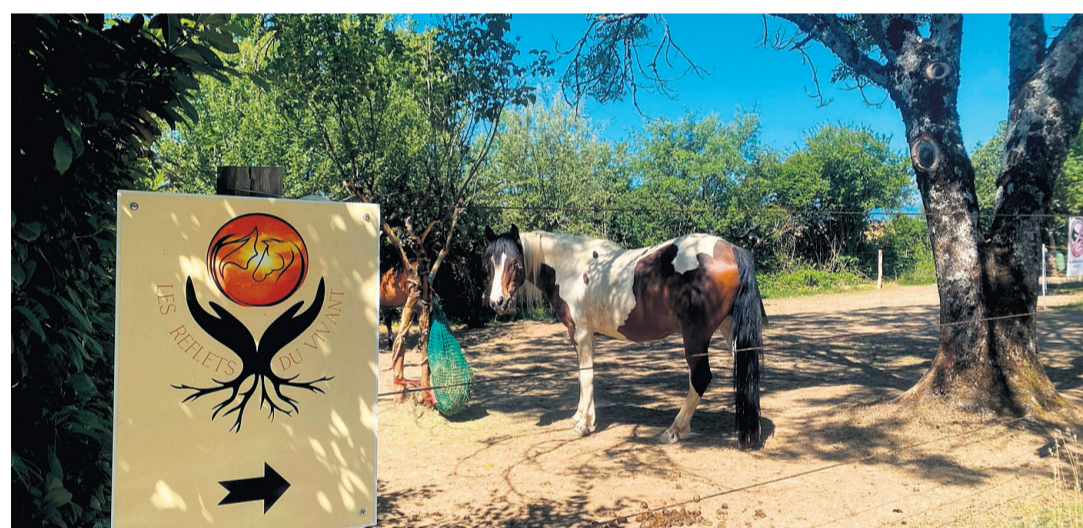
Sur le nouveau terrain de l'association Les reflets du vivant. CAROLINE DELALOYE

Grâce à la belle synergie entre le comité et l'ensemble des bénévoles, avec le soutien d'une fondation, ce terrain de 3000 m 2 alloué par un particulier a pu être entièrement installé en très peu de temps. Il devenait urgent pour l'association de trouver un nouvel endroit pour accueillir une partie de ses chevaux. C'est maintenant chose faite et le comité a à cœur d'organiser des moments de rencontre en plus de ses activités - camp d'été, ateliers de vacances les mercredis et les samedis matin