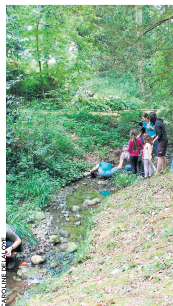
Qui se cache dans cette eau et sous ces feuilles?

Les guides ont ensuite montré des feuilles qu'ils avaient cueillies sur les arbres alentour en demandant aux enfants de les identifier et de les retrouver. L'un des parents présents a appris aux enfants une phrase mnémotechnique pour distinguer les feuilles d'un hêtre de celles d'un charme: «le charme