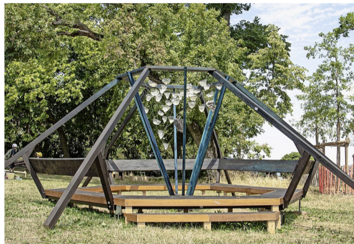
Metafora, de Psyn Fysi et Johan Rosset.

L'exposition est tout public. Le vernissage, en présence des artistes, se tiendra le vendredi 1 er septembre à 18 h au parc de la villa Greta (chemin du Champ-de-Blé 6), si la météo le permet.