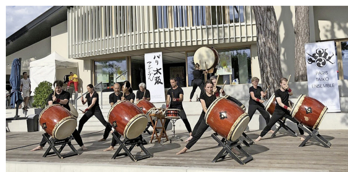
L'Ensemble Paris Taïko en action sur le parvis.

Merci aux organisateurs pour cette manifestation qui, encore une fois, a tenu toutes ses promesses, ainsi qu'aux très nombreux bénévoles sans lesquels rien de tout cela ne serait possible. Denise Bernasconi