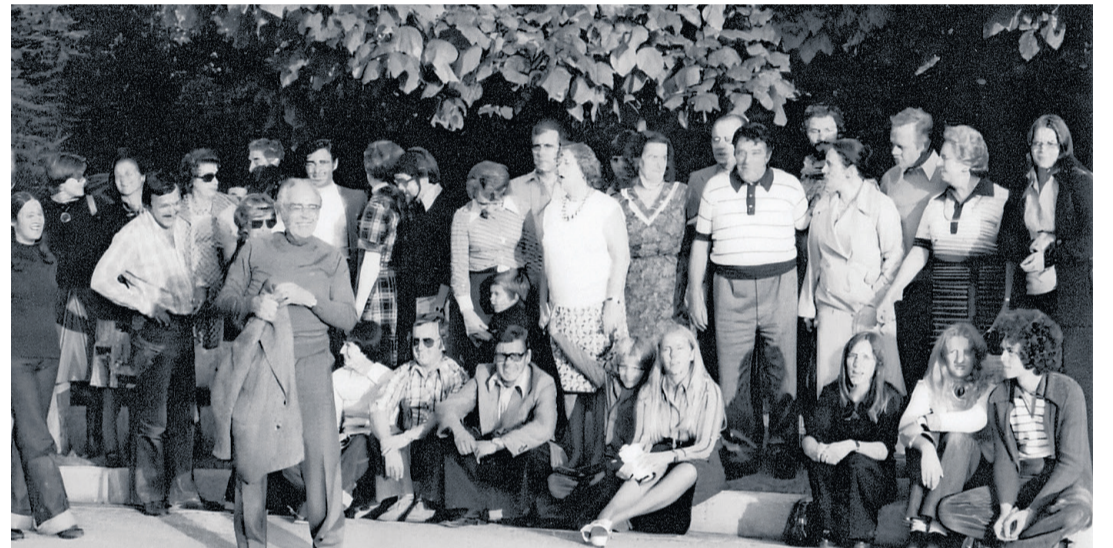
Les membres du Groupe Théâtral d'Hermance en 1974. GTH

Il y a les acteurs, mais il y a aussi les travailleurs de l'ombre, décorateurs, éclairagistes, techniciens, souffleurs, maquilleuses, costumières qui, collectivement, assurent la réussite du spectacle. Soulignons le travail considérable des décorateurs, qui ne reculent devant rien pour mettre en valeur les comédiens. En 1984, par