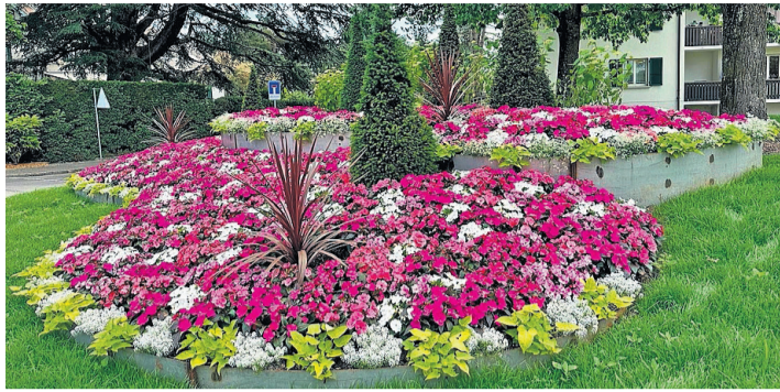
Un des massifs primés pour l'édition 2023.

La commune a reçu le 1 er prix de la Société romande des amis des roses et de l'horticulture pour la catégorie Communes Fleuries 2023, jugée sur les fleurs du mur du temple de Genthod, le massif de la route de Rennex et Valavran, le débarcadère du Creux-de-Genthod, la Cour du Château vers la mairie, et le mur au chemin de la Gandole et de Saugy. Un autre prix a été décerné: la catégorie Fontaines Fleu-