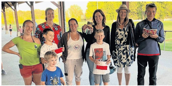
Les lauréats du quiz avec les créatrices de la Vadrouille et les représentantes de la Mairie. OLIVIER LOMBARD

La météo était idéale en ce samedi 7 octobre pour le programme que la Commune de Choulex avait concocté en relation avec l'environnement. Et c'est une assistance nombreuse qui s'est retrouvée pour inaugurer la Vadrouille que l'association Naries a créée dans la campagne choulésienne. Il s'agit d'un parcours pédestre, ponctué d'étapes où l'on trouve un code QR à scanner au moyen de son téléphone portable. On accède alors à une