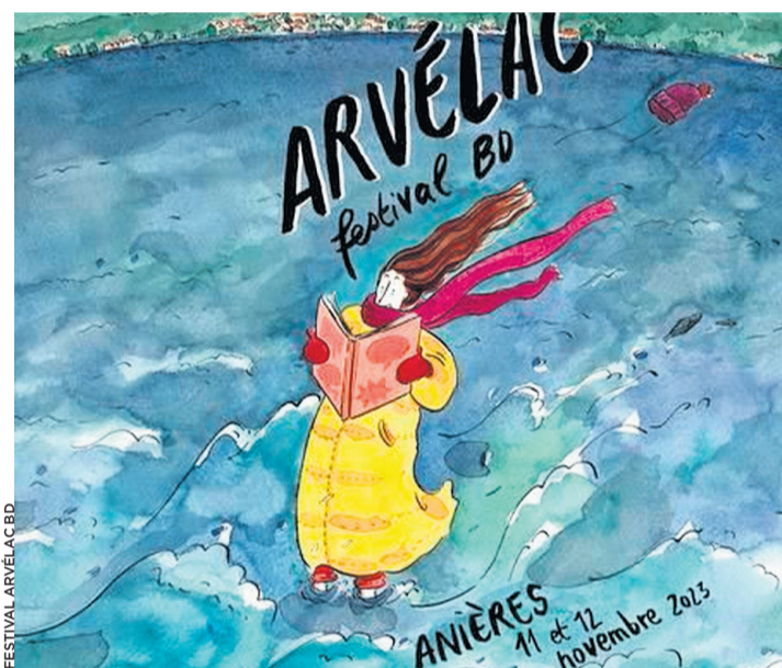
Détail de l'affiche de Fanny Vaucher pour l'édition 2023.

Le Festival Arvélac BD, c'est samedi 11 novembre de 10 h à 18 h et dimanche 12 novembre de 10 h à 17 h.