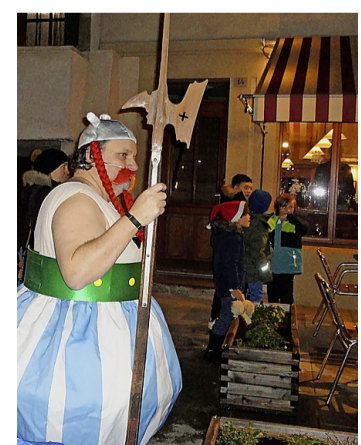
Obélix lors de l'Escalade 2022. DENISE BERNASCONI

Suivra, le samedi 9 décembre, la fête de l'Escalade. À 18 h 30, cortège aux flambeaux à travers le village puis direction la salle communale où aura lieu le concours de déguisements pour petits et grands avec atelier de maquillage pour enfants organisé par l'APEH. Fondue ou assiette valaisanne seront servies dès 20 h et sur réser-