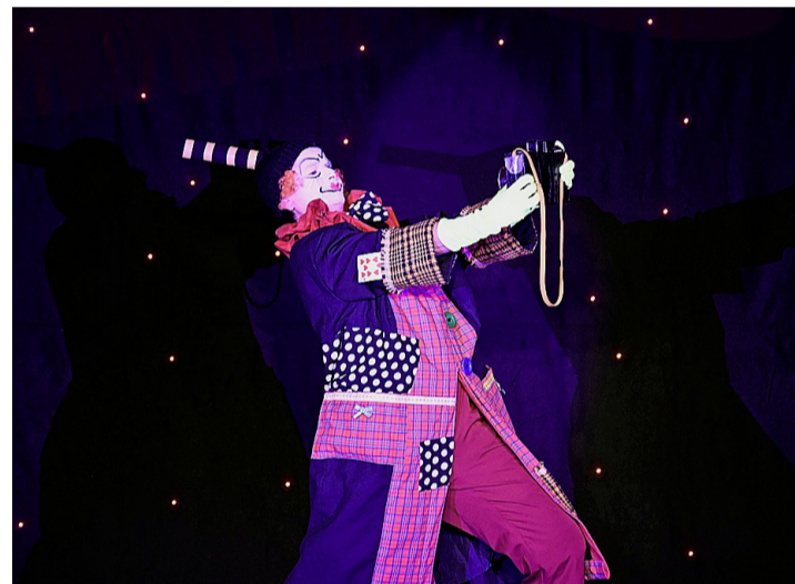
Un beau moment de poésie avec la clown. FABRICE CORTAT

sur pied non seulement un spectacle comprenant des sketches, du chant, de la danse et de l'effeuillage, tout en suivant une trame qui se déroule durant toute la soirée, mais en plus de servir un délicieux repas avec entrée, plat principal et dessert pour une centaine de personnes. Le ballet des serveuses, serveurs, sommeliers et sommières assure un service rapide et efficace, qui implique qu'en cuisine on soit prêt à dresser 100 assiettes au bon moment. Le rythme de la soirée est donc soutenu, et les spectateurs peuvent en profiter dans les meilleures conditions. Cela signifie une organisation rigoureuse, un enga-