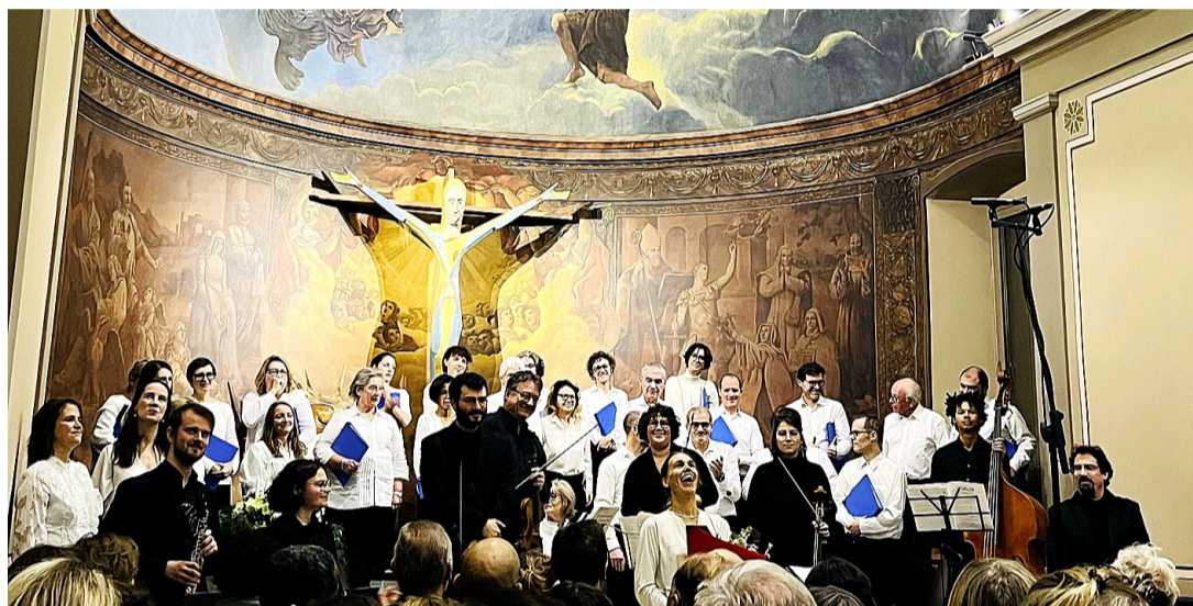
Le chœur Coherence en concert à l'église de Corsier le 16 décembre 2023. PATRICK JEAN BAPTISTE

Un bravo mérité donc au chœur, aux solistes et aux musiciens.