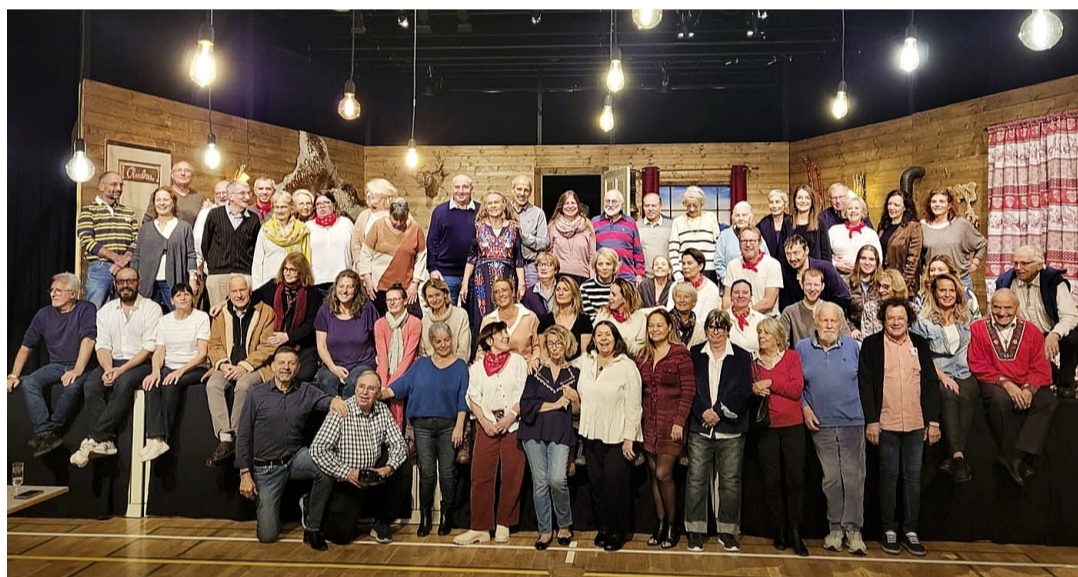
Photo de la grande famille du Groupe théâtral d'Hermance. GTH