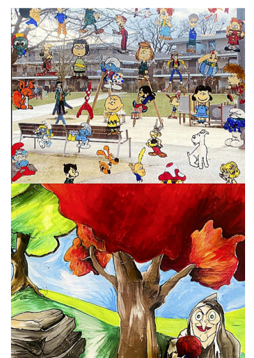
Créations des enfants du parascolaire. CORINNE SUDAN