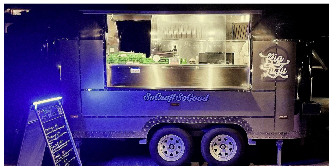
De délicieux burgers à Cologny. Ça y est! Il est arrivé au Centre sportif de Cologny. Qui donc? Big Lulu, le food truck de Cologny. En effet, Big Lulu Burgers vous sert désormais de copieux et variés burgers 100% suisses ainsi que des frites maison tous les jeudis et vendredis de 11 h à 14 h et de 18 h à 21 h. N'hésitez pas à téléphoner pour réserver vos burgers à l'avance, au 079 940 83 87. BIG LULU BURGERS