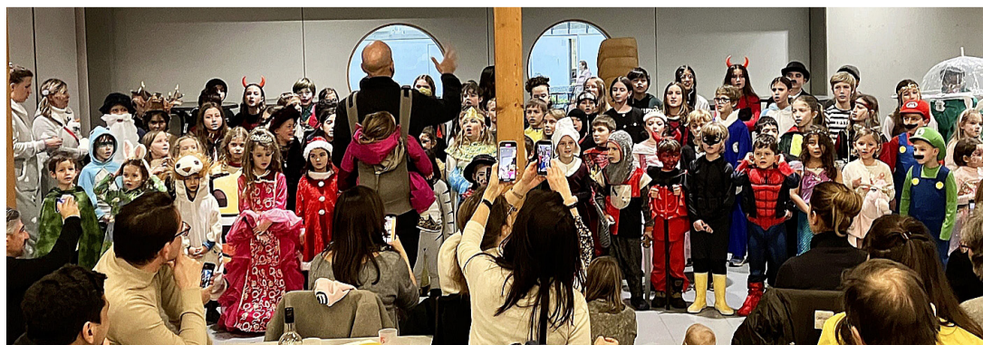
Les enfants chantent l'Escalade pour la plus grande joie de l'assistance. OLIVIER LOMBARD

La soirée s'est poursuivie avec une verrée proposée par l'Association des parents d'élèves (APECH), ainsi qu'une délicieuse soupe aux légumes et la marmite en chocolat, toutes deux offertes par la mairie. Olivier Lombard