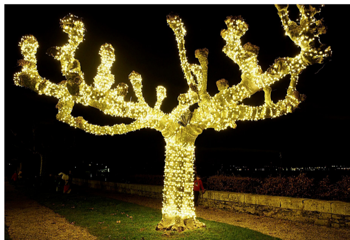
Illumination du quai. ANDREA ALIOTTI

Bravo à tous ceux qui se sont donnés sans compter pour nous offrir ces beaux moments de partage. Denise Bernasconi