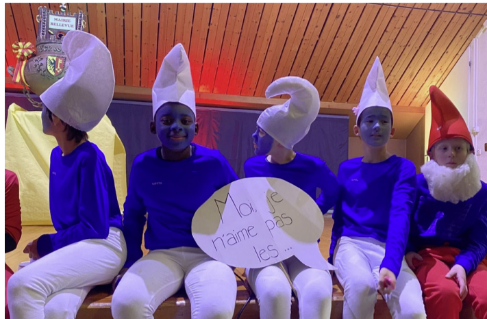
Les lauréats du concours de déguisements catégorie «grands». CAROLINE DELALOYE

La partie officielle de la fête a démarré dans la salle communale