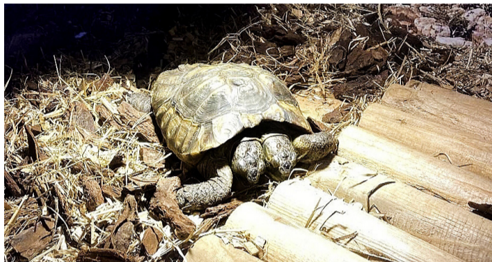
«Janus» dans son vivarium. CAROLINE DELALOYE

Pour pouvoir l'accueillir, une roulotte spécialement aménagée a été installée près de l'entrée du parc. Janus, un mâle de 26 ans, peut ainsi recevoir les soins qu-