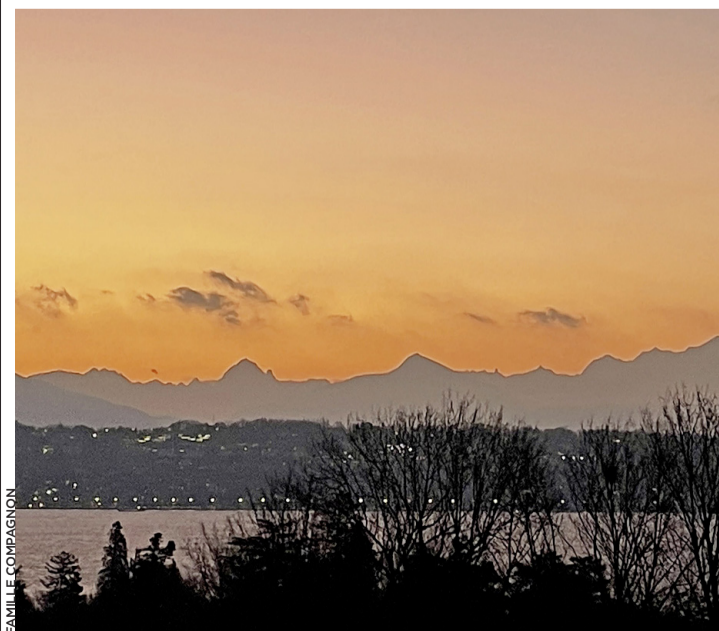
Lever du soleil depuis le banc de la route de Pregny.