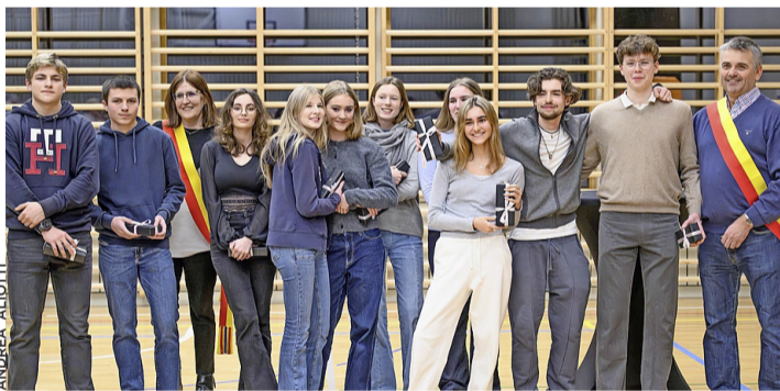
Les nouveaux citoyens ayant obtenu leur majorité civique.

En effet, ayant atteint leur majorité civique, ils ont été appelés à monter sur scène lors de l'apéritif communal en début d'année,