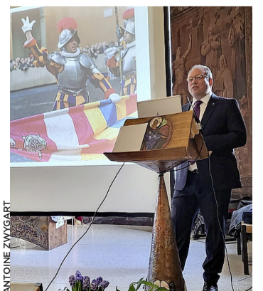
Lors de la conférence.