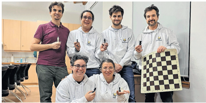
Les membres du comité. CLUB D'ÉCHECS DE BELLEVUE

L'association organise des cours réguliers pour ses membres, les lundis midi pour les enfants de la 4P à la 8P et les jeudis soir de 19 à 20 h pour les adultes et les adolescents dès la 9 e , ainsi que des tournois et des séances de jeu libre pour tous les niveaux. Ces événements sont l'occasion idéale de rencontrer d'autres passionnés et d'échanger des conseils stratégiques. Que vous soyez un joueur débutant cherchant à ap-