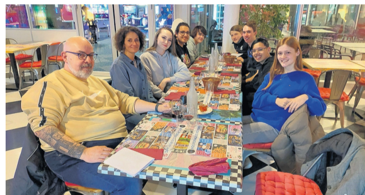
Nos jeunes attablés au bowling de Balexert. ALEXANDRE CZECH

Ils ont pu tout d'abord assister à une présentation de la commune et de ses principales caractéristiques, telles que: sa géographie, l'impact des organisations