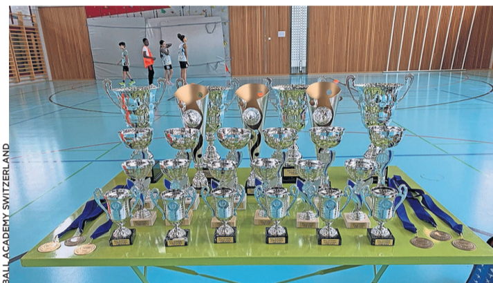
Inscrivez-vous jusqu'au 11 avril pour le Genthod 3x3.

Le basket 3x3 a des règles différentes du basket «classique», car on n'utilise que la moitié du terrain et un panier. Entre autres, les équipes sont composées de trois joueurs plus un remplaçant, les changements se font en cours de match, sans interruption, et la première équipe qui marque 21 points est gagnante, en sachant que le match dure au maximum dix minutes. Toutes les règles sont disponibles en français sur le site de