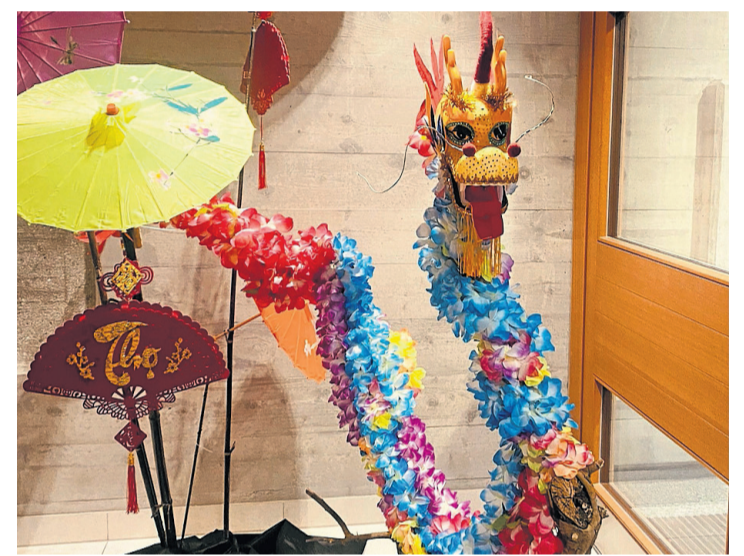
Le dragon de bois avec tout son panache. CORINNE SUDAN

Après une petite pause, une représentation des arts martiaux de la Fédération Vovinam Viet Vo Dao Suisse, accompagnée par le maître Tân Rousset et les enfants. Pour terminer, le public s'envola jusqu'au carnaval de Rio de Janeiro avec un show de samba, invitant ceux et celles qui le désiraient à se laisser aller dans la danse.