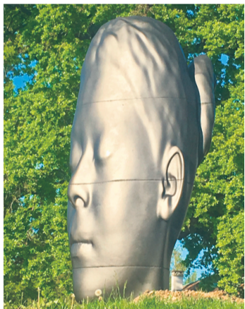
La sculpture de Jaume Plensa, haute de 4,50 m. CATHERINE GAUTIER LE BERRE

New York, Londres, Shanghai, Cologny... À la route de la Capite, en montant à droite, située dans le parc de la Mairie, on ne voit qu'elle depuis qu'elle est arrivée, lundi dernier. Le cadeau de la Commune à ses habitants, ce gracieux visage féminin introspectif, sculpté par le phénoménal Jaume Plensa, sculpteur humaniste connu internationalement, notamment pour sa sculpture dédiée, par le secrétaire général de l'ONU, à la mémoire des journalistes tués en mission. Merci, on en est fier. Elle est si belle, sublime, et elle restera, pensive, sur territoire colognote. À voir tous les jours, on ne s'en lassera pas. C.G.B.