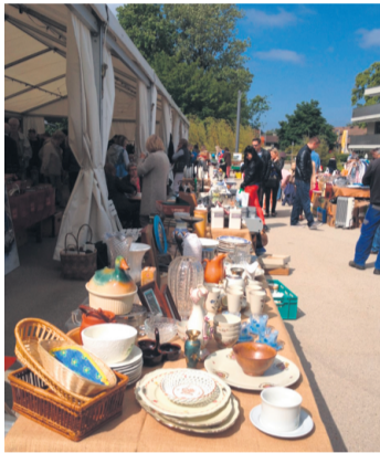
L'année dernière, l'événement a remporté un franc succès.

Cette année encore, pour sa 6 e édition - qui se tiendra comme à son habitude sur l'esplanade de