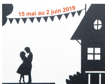
Détails d'une œuvre.

Du 18 mai au 2 juin, Lanfranco Corsi expose ses peintures sur toile sous le titre «En scène» à la Galerie le clin d'œil. Vernissage le 15 mai dès 18 h.