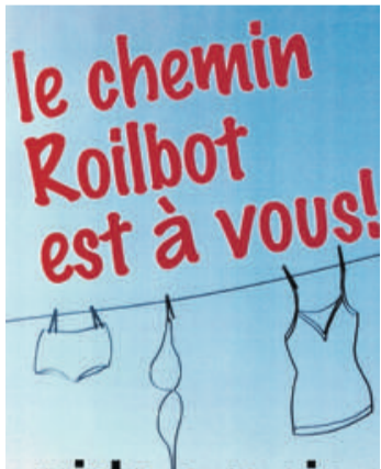
Détail de l'affiche.