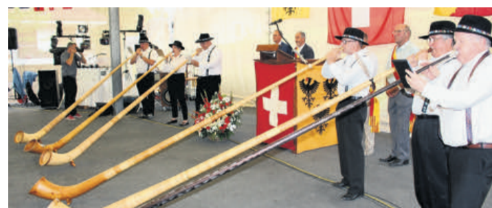
Au ciel montent plus joyeux les sons de ces magnifiques instruments. JEAN-PIERRE ABEL

Lorsque dans la sombre nuit un feu de joie illumine tout l'espace, notre cœur se remplit d'émotions, en admirant ce grand foyer bien gardé par les pompiers