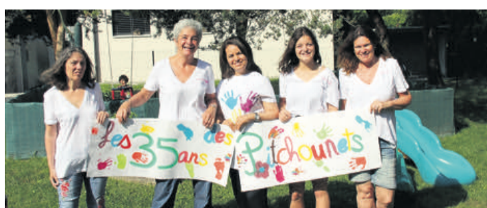
Les professionnelles du jardin d'enfants. LA MAIRIE

Des animations sont venues agrémenter cet anniversaire. En effet, les enfants ont assisté à un