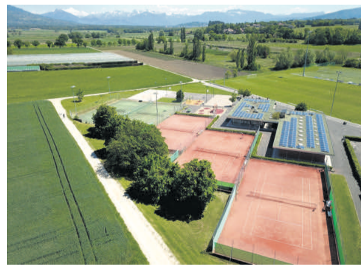
Le centre sportif de Rouelbeau sera le théâtre des festivités du 1 er septembre prochain. EMILIE NASEL

Venez donc nombreux fêter les 20 ans du Tennis Club de Meinier lors de cette journée qui se doit d'être ensoleillée - à savoir qu'en cas de pluie l'événement sera annulé. Plus d'infos sur tmeinier.ch