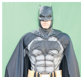
Il était possible de se faire photographe en compagnie de Batman lui-même!

Pour ma part, j'ai assisté le samedi, par une belle soirée estivale, à la projection de «Lego Bat-