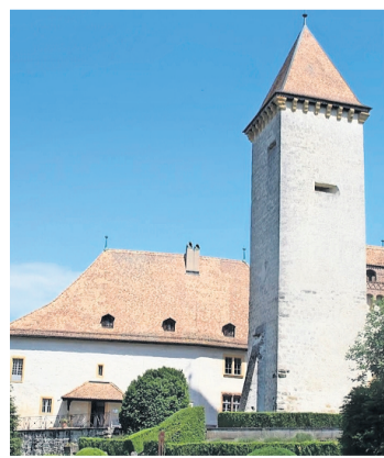
Château de La Sarraz.

Deux autocars ont transporté les Bellevistes jusqu'au château de La Sarraz, dans le canton de Vaud. Cet édifice, dont la première construction - un simple donjon - remonte à 1049, a appartenu pendant près de neuf siècles aux descendants d'une même famille, soit par mariage, soit par héritage, en particulier les de Grandson et les de Gingins. Ce château est maintenant transformé en musée et offre la possibilité de visiter une très belle résidence seigneuriale laissée en l'état, telle que l'ont