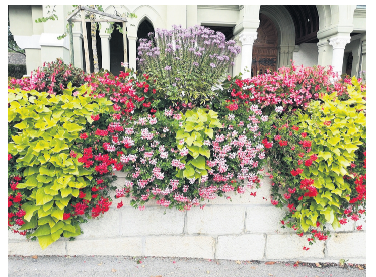
Le massif de fleurs se trouvant devant l'église. TARA KERPELMAN PUIG

À Genthod, on peut compter au moins 15 variétés de fleurs, toutes issues de producteurs de notre canton, comme les bégonias, cléomes, fuchsias, ipomées, certaines se trouvant dans une des centaines de bacs à fleurs que compte la commune.