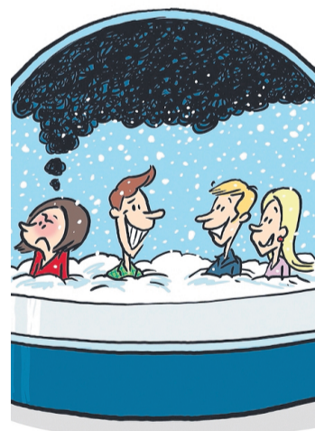
«Venise sous la neige».

Un humour accessible et rythmé par des dialogues incisifs qui font mouche dans une histoire moderne et enjouée. De quoi passer une ex-