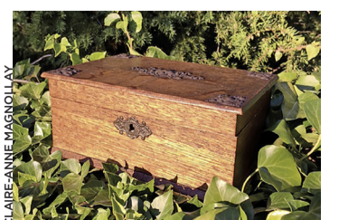
Contes de forêt.

Inscription obligatoire à l'adresse biblio@pregny-chambesy.ch