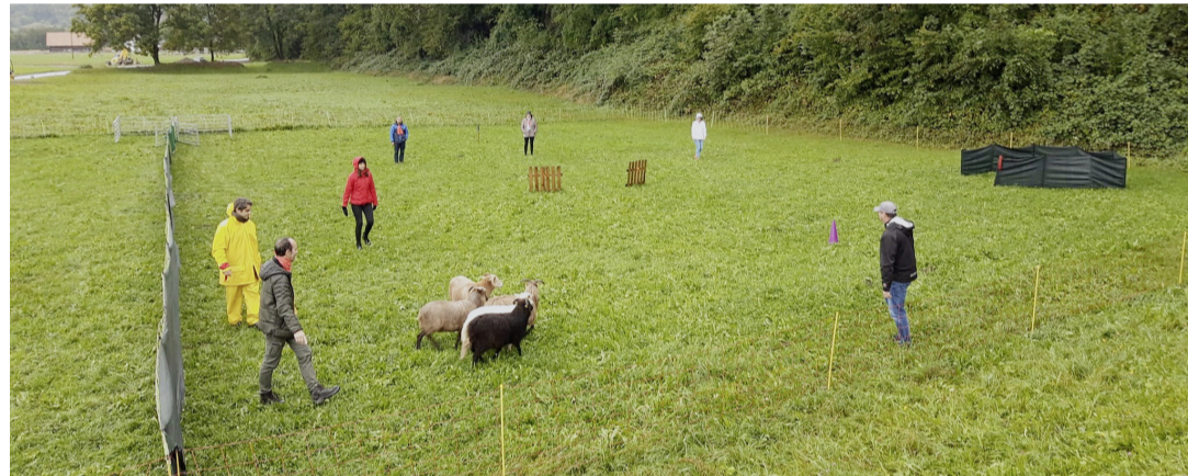
Les conseillers et conseillères en plein apprentissage. MAIRIE DE MEINIER

Cette année, Législatif, Exécutif et personnel communal se sont rendus aux confins du canton de