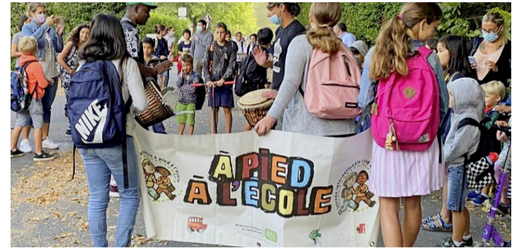
Le cortège qui s'est formé lors de la Journée internationale À pied à l'école.

Les prochains événements ne sont pas encore garantis, comme la fabrication et distribution de la soupe de l'Escalade ou le stand tenu lors de la fête des promotions. Cependant, si l'APEB ne manque pas d'idées et de personnes motivées dans son comité pour les mettre en place, la réalisation de ses activités dépend éga-