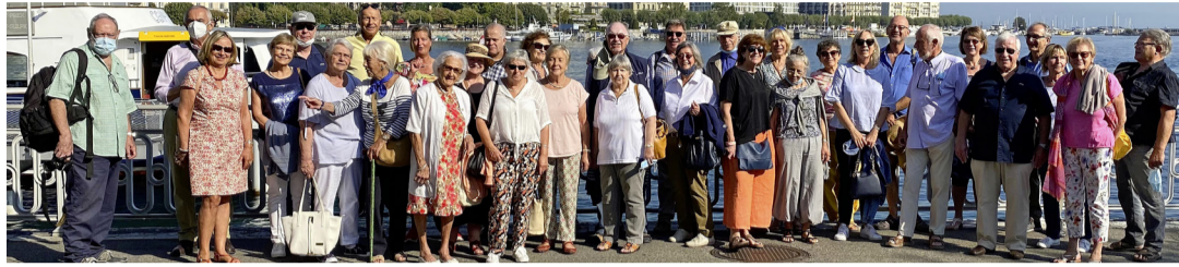
Photo de famille au Jardin anglais.