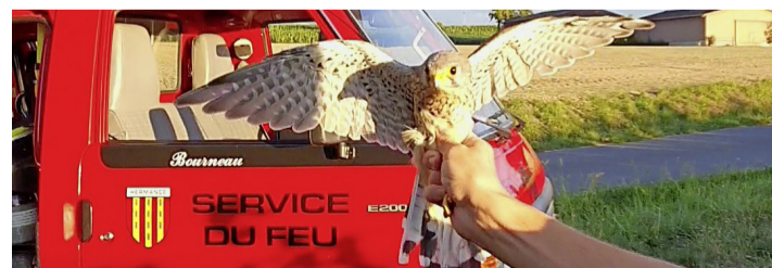
Le faucon crécelle prêt à s'envoler. STÉPHANE HOLZER

Une intervention délicate pour libérer le rapace, un magnifique faucon crécelle, bien empêtré