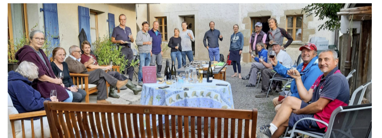
La famille Villard fête la fin de la vendange. ANTOINE ZWYGART