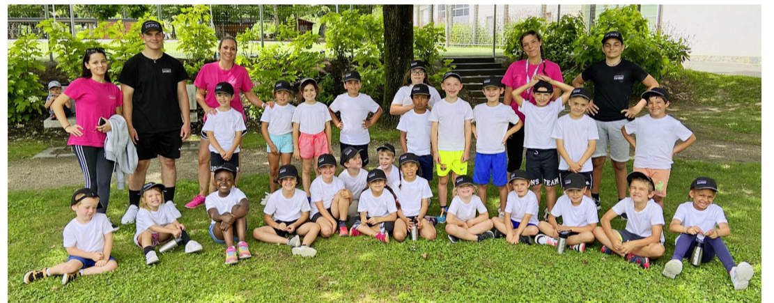
Les participants du camp de sport en juillet 2020. KID'SPORT

Il ne s'agit pas seulement d'apprendre à pratiquer un sport spécifique, mais de présenter l'activité physique sous toutes ses formes: en marchant, en sautant, en dansant, en faisant de la relaxation, du Pilates et des activités sportives plus dynamiques également.