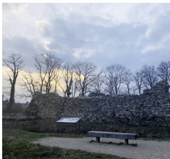
Les murs du château de Rouellebeau. KARINE DARD

Il aura fallu quinze ans pour que nous puissions enfin revoir ses vestiges d'antan se dresser fièrement. À l'automne 2016,