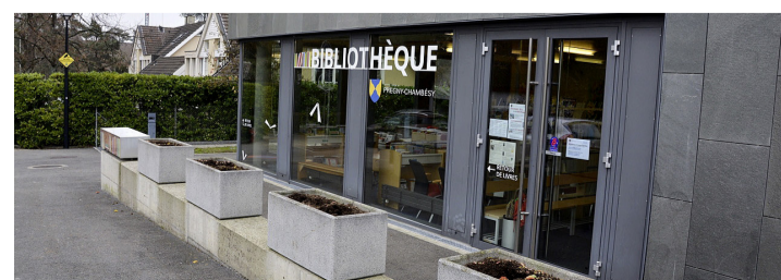
Le bâtiment qui abrite la bibliothèque.