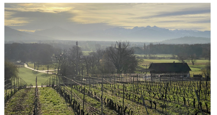
Vue sur les vignes du coteau de Choulex. DOMINIQUE MORET

La boutique Du mardi au vendredi de 9 h 30 à 12 h et de 13 h 30 à 18 h, au chemin des Avallons 30. Tél. 022 751 33 42 et 079 617 42 96.