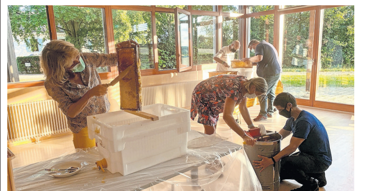
Les participants en plein travail de récolte. DOMINIQUE MORET

au 077 438 31 40 et sur www.printempsdabeilles.ch