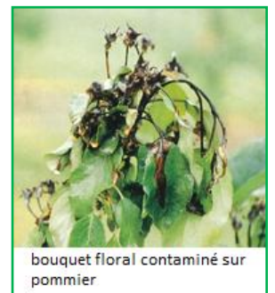
bouquet floral contaminé sur pommier

Aucune méthode de lutte efficace n'est disponible actuellement contre le feu bactérien. Les mesures préventives restent le seul moyen pour enrayer la propagation en surveillant les plantes hôtes et en éliminant systématiquement les foyers correspondants ; ces mesures permettent d'empêcher le développement du feu bactérien à Genève et elles doivent être poursuivies, car les pertes économiques peuvent être importantes pour nos arboriculteurs.