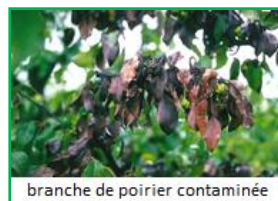
branche de poirier contaminée

À part les pommiers, les poiriers et les cognassiers, les plantes ornementales ou sauvages suivantes peuvent également être atteintes de feu bactérien : alisier, alouchier et sorbier des oiseleurs, aubépine, buisson ardent, cognassier du Japon, cotonéasters, néflier, néflier du Japon, Stranvésia.