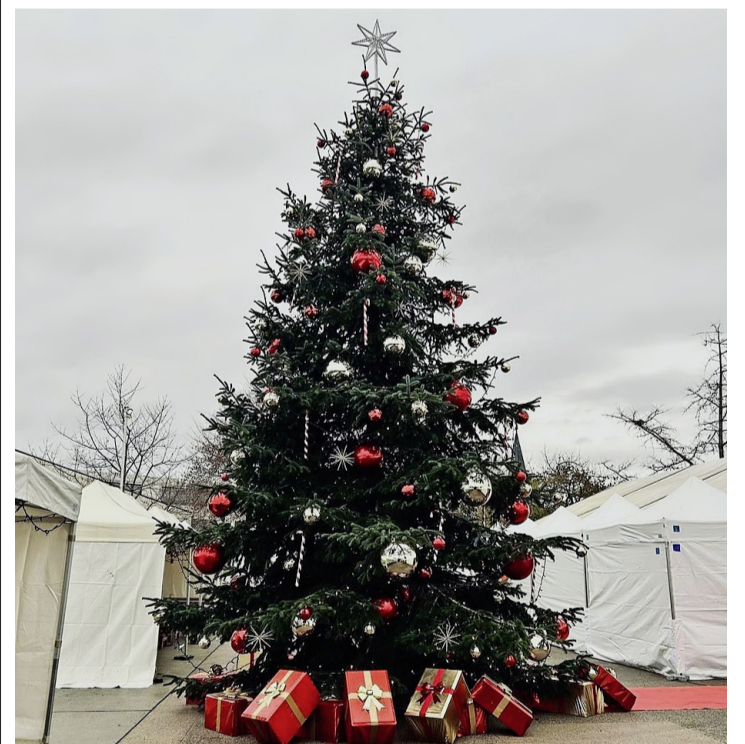
Mon beau sapin, roi des forêts. CORINNE SUDAN

La Commission Manifestations, Sport et Événements a tout mis en œuvre, pour que cette manifestation annuelle soit inoubliable aux yeux des tout-petits et des grands. Corinne Sudan