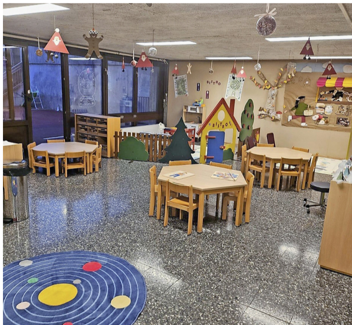
Vue sur une des pièces de ce nouveau lieu d'accueil pour la petite enfance.

Ce nouveau service flexible aide les familles en proposant une solution de garde ponctuelle tout en favorisant la socialisation et le développement des jeunes enfants tout en douceur.