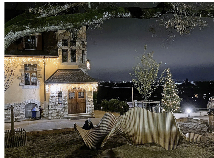
Jeu de lumière autour de l'école primaire. OLIVIER LOMBARD