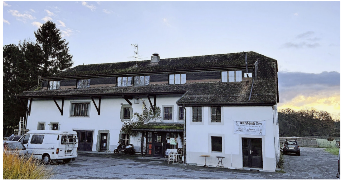
La bâtisse du XIX e siècle sise sur la parcelle. PATRICK JEAN BAPTISTE

Les autorités communales avaient déployé des efforts pour